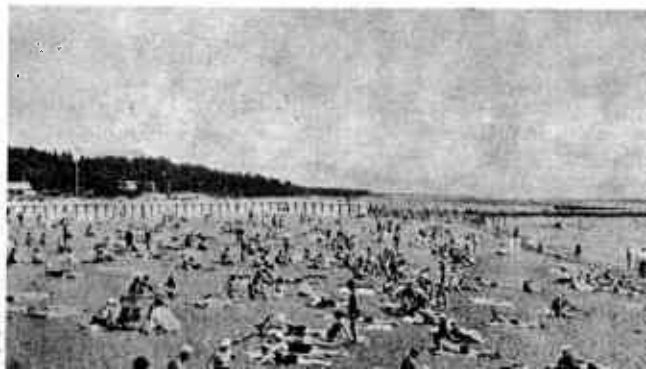
Meren ja hiekan lumoissa.

Luonto Terijoella on ihastuttavan kaunista, sillä monin paikoin on tuuheita, viihdyttäviä, reheviä puistoja, jollaisten siimeksessä m.m. useimmat täysihoitolat sijaitsevat. Luonnon»