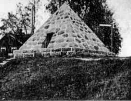
Joutselän taistelun muistomerkki.