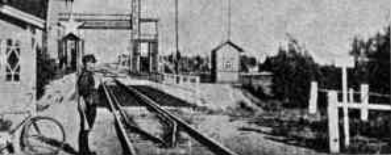
Lännen ja idän raja.

metsiköt rehevine kasvillisuuksineen ja rauhallisine metsäpolkuineen tarjoavat oivallisia retkeilykohteita. Ja niin »merenhengessä» kuin Terijoki eläekin, ei puutu myöskään sisämaan runollisen kauniita järviäkään, sillä niitäkin on vieraan varaksi.