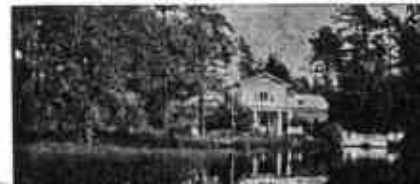
Huvila »Ainola» Terijoella.