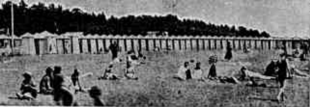
Auringonpalvojia Merikylpylän hiekalla.

Aurinkoa voi jokainen vapaasti, rahatta ja hinnatta, saada itsellensä millä kohdalla hyvänsä lähes 30 km. pituisella Suomenlahden rantavyöhykkeellä.