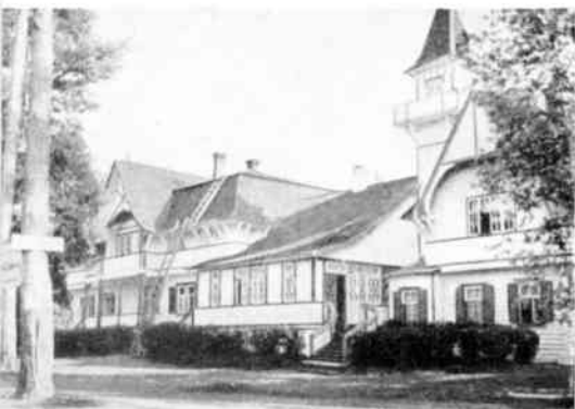
Terijoen Merikylpylä Kasino